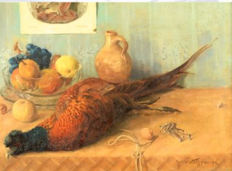
8 Natureza-morta: Óleo sobre tela