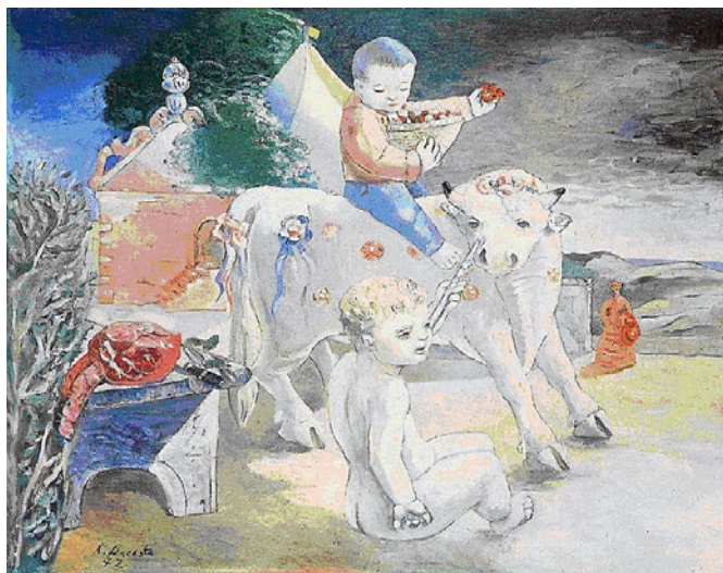
António Dacosta, A Festa, 1942