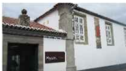
NÚCLEO DE HISTÓRIA MILITAR MANUEL COELHO BAPTISTA DE LIMA Rua da Boa Nova 9700-031 Angra do Heroísmo