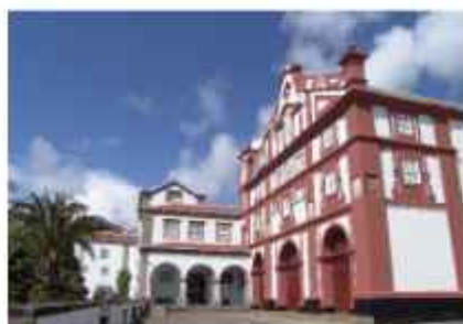
MUSEU DE ANGRA DO HEROÍSMO (EDIFÍCIO DE SÃO FRANCISCO | SEDE) Ladeira de São Francisco 9700-181 Angra do Heroísmo