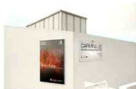
CARMINA | GALERIA DE ARTE CONTEMPORÂNEA DIMAS SIMAS LOPES Duteiro do Galhardo, 13-A, Ladeira Grande 970-353 Angra do Heroísmo