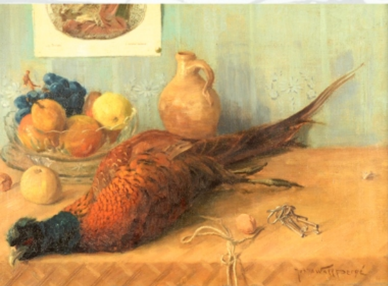
8 Natureza-morta: Óleo sobre tela