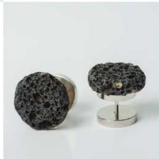
Acessórios de homem Botões de punho, anel, colares e pulseiras Ondina Vieira Pedra de basalto, metal e couro Várias dimensões