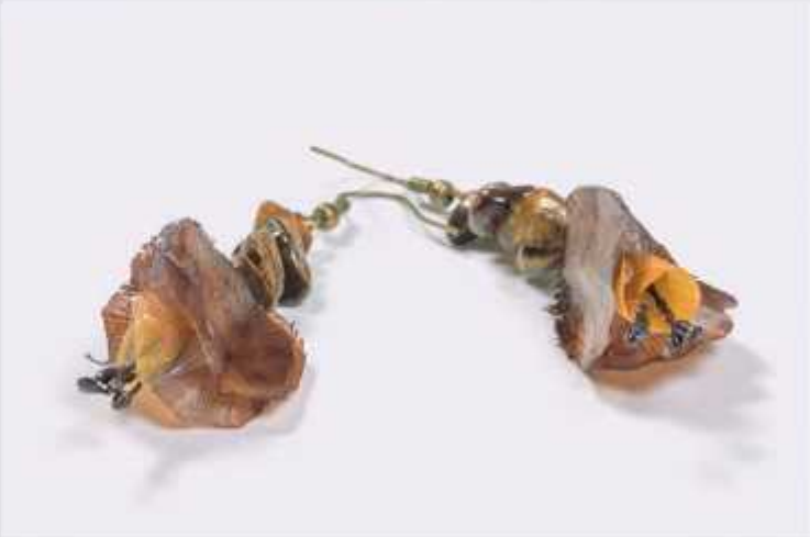
Brincos Isabel Silva Melo Escama de peixe, pedras naturais e vidro de Murano Várias dimensões