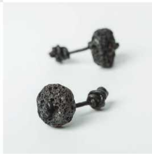
Men accessories Cufflinks, ring, necklace and bracelet Ondina Vieira Basalt stone, metal and leather Various dimensions